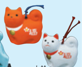
土鈴 初穂料 500円