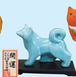
青磁 初穂料 1,000円