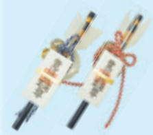
交通安全幸先矢 初穂料 500円