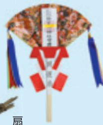
扇 初穂料 2,000円 ミ二扇 初穂料 1,000円