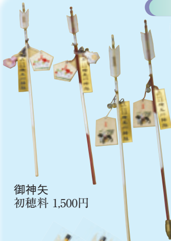
御神矢 初穂料 1,500円