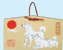
絵馬 初穂料 800円