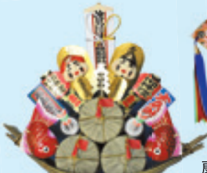
宝船 初穂料 (大) 7,000円 (中) 5,000円 (小) 3,000円