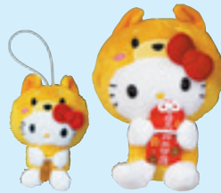
干支キティマスコット (大) 初穂料 2,000円 (小) 初穂料 1,500円