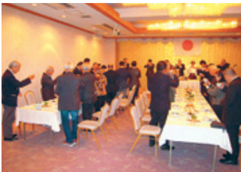
直会・御神酒拝戴