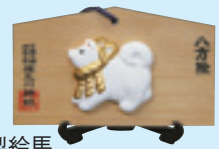
陶製絵馬 初穂料 1,200円