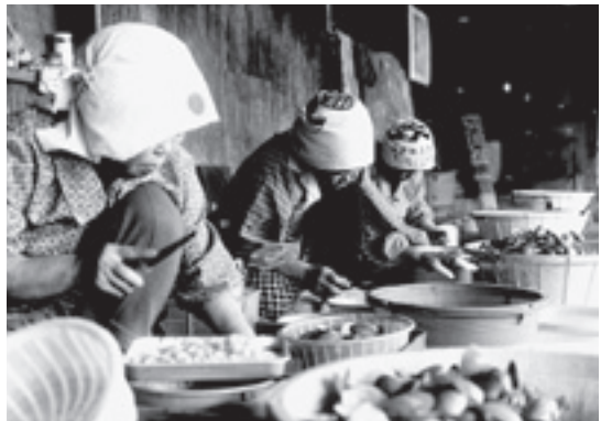
□貝むきの様子（昭和五十六年） かつて検見川の海ではアサリや赤貝、渡り 蟹など魚貝類が豊かに獲れたそうです。