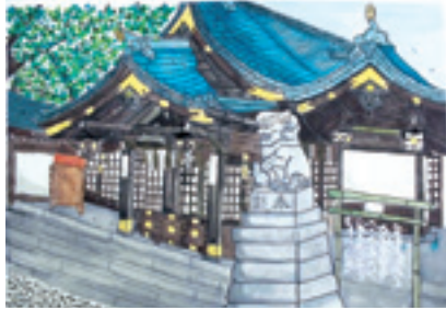
構図を工夫して、遠近感を出しました。鮮やかな色使いで神社の厳かな雰囲気表現しました。

作品はどれも素晴らしい出来栄でした。代表して三点の作品を引率された先生のご講評を添えてご紹介させていただきます。