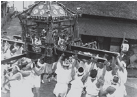
□夏まつりの様子（昭和二十八年） 神輿渡御。「さしてもめ」のかけ声が今にも 聞こえてきそうです。