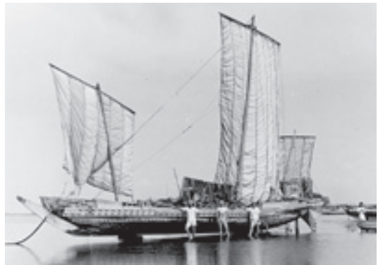
□大型帆船「打瀬船」（昭和三十一年） かつて検見川は打瀬船保有台数一位の大きな港 町でこの船で漁を行っていました。写っている 漁師さんと比べると、その大きさがわかります。