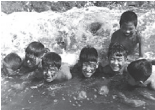
□海で遊ぶ子どもたち（昭和三十三年） 子どもたちにとって海は身近な遊び場でした。

新井氏は検見川の町や海の風景を永年 にわたり撮り続けてきた方です。今度貴 重な写真を数多く奉納いただきました。 ここに紹介いたします。