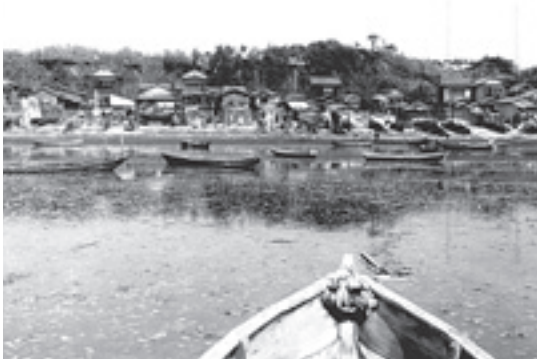
□海からみた検見川のまち（昭和四十二年） 正面は五丁目の三峰神社の森です。 現在の海岸線は埋め立てにより、遠く 4 km 先になってしまいました。